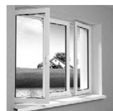
РАССРОЧКА ДО 6 МЕСЯЦЕВ.

Контактный телефон для обращения к страховому представителю указан на вашем полисе ОМС! Звоните!